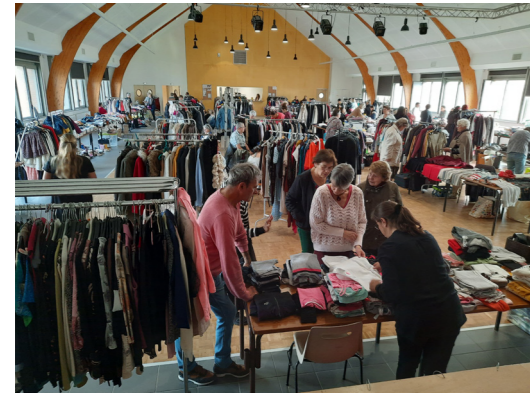
16 octobre - Vide-dressing - 35 exposants pour tenir 150 emplacements

L'année s'est terminée avec la Bourse aux jouets qui s'est tenue à la salle des fêtes les 3 et 4 décembre.