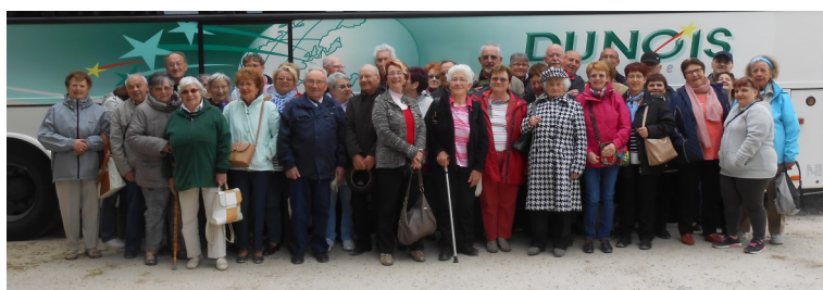
Sortie à Vaux le Vicomte

Renseignements au 02 38 33 34 16 ou joiedevivre45270@gmail.com