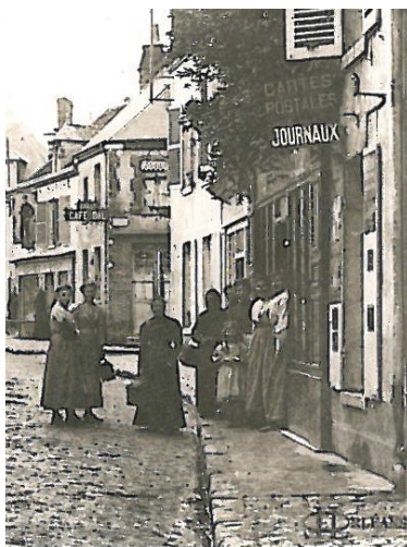
Scène de rue à Bellegarde. 1 er quart du 20 e siècle

La programmation culturelle 2020 se peaufine et Gwennaëlle Le Barber, chargée du développement culturel, est à la recherche de comédiens et figurants bénévoles pour cet été.