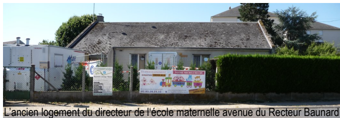
L'ancien logement du directeur de l'école maternelle avenue du Recteur Baunard

Renseignements et inscriptions : 07 83 50 71 12 pitchounsetcie@gmail.com Pitchouns & Cie