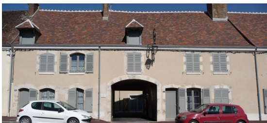
17 rue Demersay : 6 nouveaux logements habités depuis février dernier.

Dans la cour, 2 maisons de ville de 3 pièces ont été construites et bénéficient d'une terrasse.