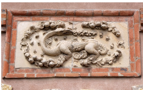
Salamandre sculptée sur la façade de la mairie

Emblème de François 1 er qui symbolise le pouvoir sur le feu (sous-entendu sur les hommes et sur le monde) et dont la devise « Nutrisco et extingo » signifie « Je m'en nourris et je l'éteins ».